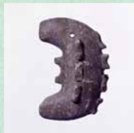
布留遺跡出土 子持勾玉 古墳時代