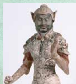
加彩武人俑 唐時代