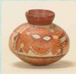
壺(笏杖を持つ擬人化された神)※部分的贋作 ナスカ文化/ナスカ中期(後300年頃~400年頃) 現代(推定/20世紀)