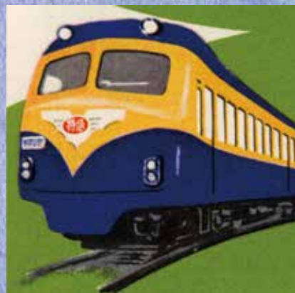
「特急ピスター運転記念乗車券」よりピスターイラスト 大阪~三重 昭和33年

本展では乗車券や関連する紙資料を中心に各路線の形成過程をたどり、新規路線開業やM&Aがダイナミックに行われていた頃に光を当てます。日本最大の私鉄黎明期における脈動を感じていただければ幸いです。