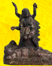
カーリー女神像 20世紀前半