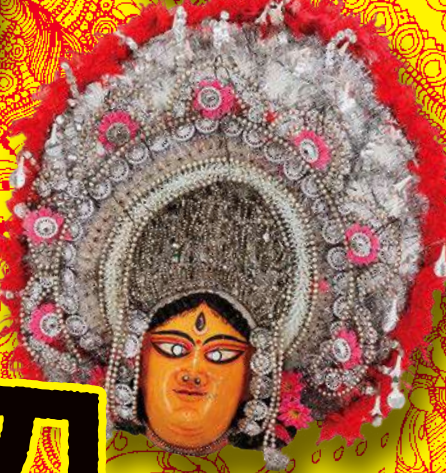
仮面舞踏劇 「チョウ」の仮面:ドルガー女神 西ベンガル州ブurlリア 20世紀後半