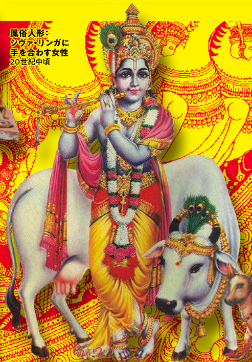
大衆宗教画:牛飼いクリシュナ神(部分) ウッタル・プラデーシュ州ワーラーナジー 20世紀後半

背景:手描き更紗の寺院壁掛け「カラムカリ」(部分) アーンドラ・プラデーシュ州カラハステイー 20世紀中頃