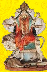
ドゥルガー女神像 20世紀中頃