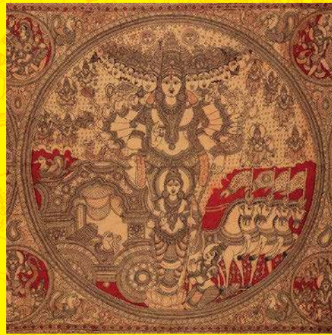
手描き更紗の寺院壁掛け「カラムカリ」(部分) アーンドラ・プラデーシュ州カラハステイー 20世紀中頃