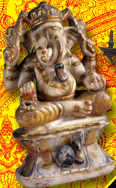
ガネーシャ神坐像 伝18世紀