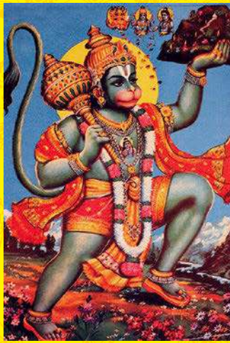
大衆宗教画: 猿神ハヌマーン マハーラーシュトラ州ムンバイ 20世紀後半