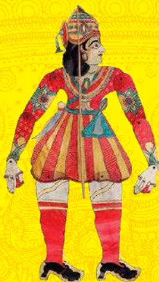
影絵人形「トル・ボンマラータ」: 武人 アーンドラ・プラデーシュ州 20世紀後半

ヒンドゥーの世界はなかなか馴染みの無いものかもしれませんが、グローバル化が進んだ今日、様々な宗教を信仰する人々と接する機会も増えてきています。本展がインドの宗教的知識を深め、異文化理解の一助になることを期待します。