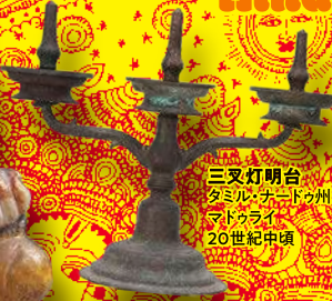
三叉灯明台 タミル・ナードゥ州 マドurai 20世紀中頃