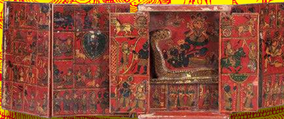
絵解き神棚「カワド」 20世紀中頃