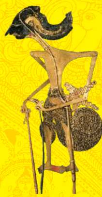
影絵人形: アルジュノ王子 インドネシア/ジャワ島 20世紀前半