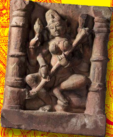
サラスヴァティー女神坐像 クルジャラ・プラデー・ハラ朝(10世紀)