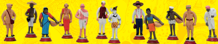
風俗人形 西ベンガル州コルカタ 20世紀後半