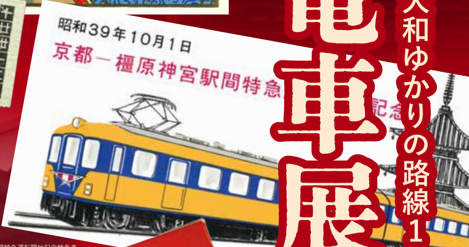
京都—橿原神宮駅間特急運転開始記念特急券 近畿日本鉄道 昭和39年