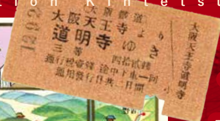
常備片道乗車券 大阪鉄道、大阪天王寺より道明寺ゆき 大正12年