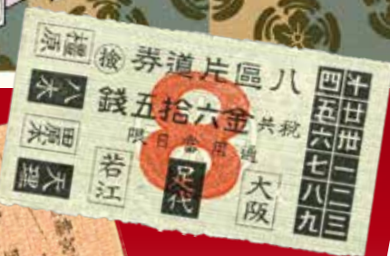
8区片道券 大阪電気軌道 大正13年