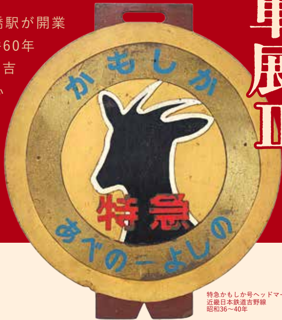
特急かもしか号ヘッドマーク 近畿日本鉄道吉野線 昭和36～40年

今年は大和ゆかりの近畿日本鉄道橿原線全通や南大阪線の大阪阿部野橋駅が開業して100年となります。また奈良電気鉄道(現京都線)の合併60年を迎えます。本展では、橿原線、南大阪線、京都線、田原本線、吉野線等、奈良やその周辺路線の中で節目にあたる路線を中心に取り上げ、近畿日本鉄道が今日の姿になりゆく経緯や、交通が地域に与えた経済・観光・文化等の影響についてご覧いただきます。新規路線開業やM&Aがダイナミックに行われていた頃に光を当てることで、日本最大の私鉄黎明期における脈動を感じていただければ幸いです。