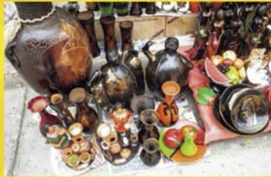
カカオス町の民芸品露店

インカ帝国のイメージが先行しがちな中央アンデス地帯ですが、本展を通じて多様な文化の存在と現代ペルー社会に生きる人々のたくましさを感じていただければ幸いです。