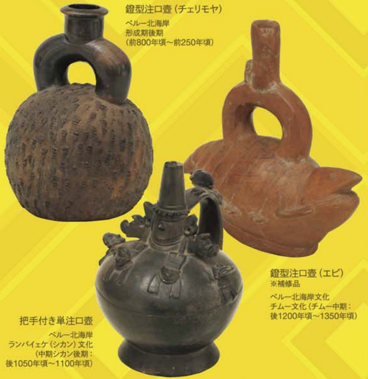
鍍型注口壺(チェリモヤ) ペルー北海岸 形成期後期 (前800年頃～前250年頃)