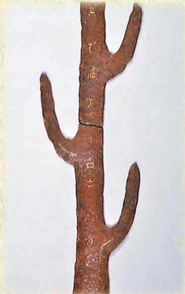
▲石上神宮七支刀 [部分拡大] (表) (写真パネル展示)