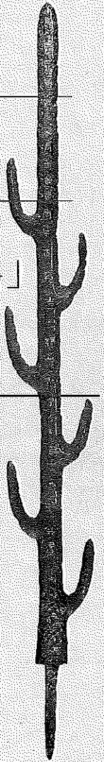
七支刀 (写真パネル展示)