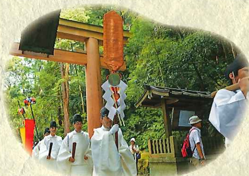
▲石上神宮 神剣渡御祭(6月30日)