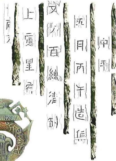
▲中平銘鉄刀の銘文

展示と講演をとおして、皆さまを、古代ロマンに満ちた春から初夏へと移りゆく 天理・山の辺の道へと誘います。