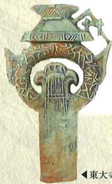
◀東大寺山古墳出土 青銅製環頭(模造品)